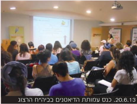
20.6.13. כנס עמותת הדיאטנים בביה"ח הרצון