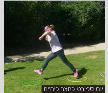
יום ספורט בחצר ביה"ח